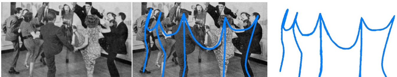
Abbildung 5: Ordnungsbildung Swingen

Parallele alltägliche Klangorganisationen verweisen auf das regelmäßige Aufschlagen von Wellen an einem Ufer. Die Dynamisierung durch das dominant gekrümmte Modellsegment und die differenten Zeitwerte der Noten begründen eine Betonung auf der Schwingung. In der fortlaufenden Periodizität wird so eine wiederkehrende kreisende, zumindest aber pendelnde Bewegung erzeugt.