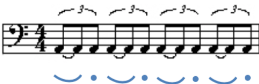
Abbildung 4: Klangorganisation Swing

Die formale Klangorganisation von Swing im Notationssystem wird interessanterweise lediglich durch einen Hinweis über der Partitur „in Swing spielen“ und/oder einen Notenwert hinweis ausgewiesen. Darüber wird deutlich, dass zwei Achtelnoten wie eine Triole zu spielen, jedoch die ersten beiden zu überbinden sind. Der swingende Rhythmus ist damit eine lediglich verdeckte und also geheime Transformation des Marsches und zeigt ein latentes widerständiges Potenzial gegenüber seiner gerichteten Gleichförmigkeit an. Dargestellt im gekerbten Notensystem ergibt sich so folgender Bewegungsalgorithmus: